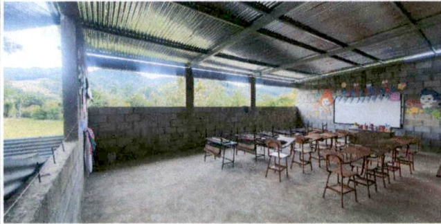
Foto7: Aula nueva