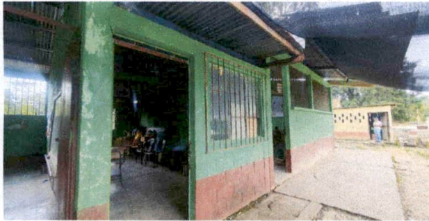
Foto 3: Bodega y/o direccion, paredes en riesgo y techo mal estado