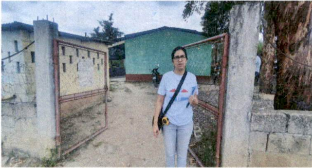
Foto1: Foto consultor